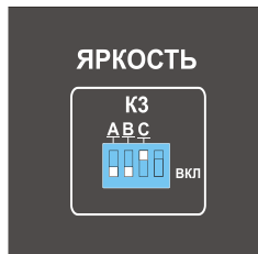
Рисунок 3.2 Окно «ЯРКОСТЬ»

Для дискретного изменения яркости свечения табло воспользуйтесь окном яркость. Максимальная яркость свечения табло соответствует нижнему положению переключателей А, В, и С. Верхнее положение переключателей снижает яркость примерно в два раза.