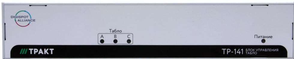
Рисунок 2.2 - Вид со стороны передней панели

Внешний вид Блока показан на рисунках 2.3 и 2.4.