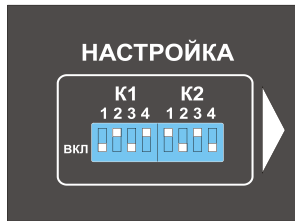
Рисунок 3.1 Расположение переключателей окна «НАСТРОЙКА» по умолчанию

Для дискретного изменения яркости свечения табло воспользуйтесь окном яркость. Максимальная яркость свечения табло соответствует нижнему положению переключателей А, В, и С. Верхнее положение переключателей снижает яркость примерно в два раза.