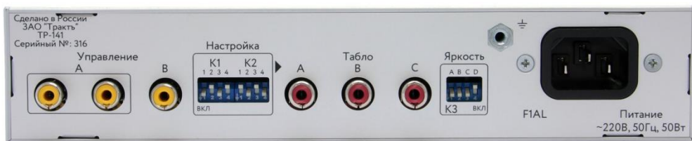
Рисунок 2.3 Вид со стороны задней панели