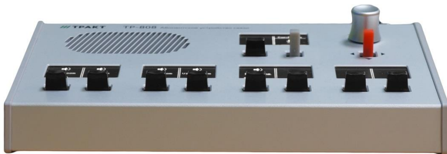
Рисунок 2.2 - Блок TP-808. передняя панель

Внешний вид передней панели блока TP-808 показан на рисунке 2.2.