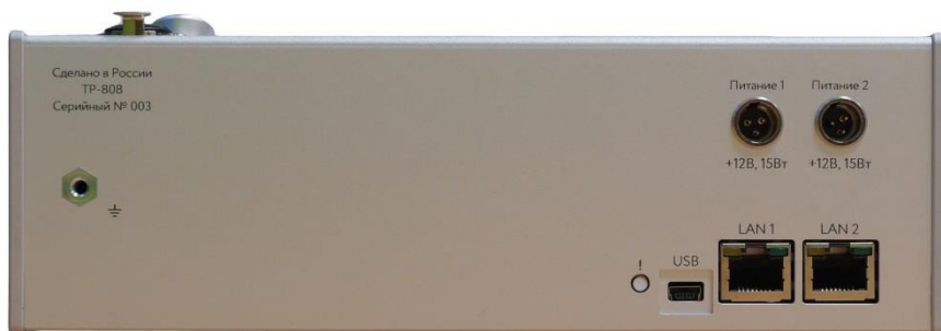
Рисунок 2.3 - Блок TP-808. задняя панель

Внешний вид задней панели блока TP-808 показан на рисунке 2.3.