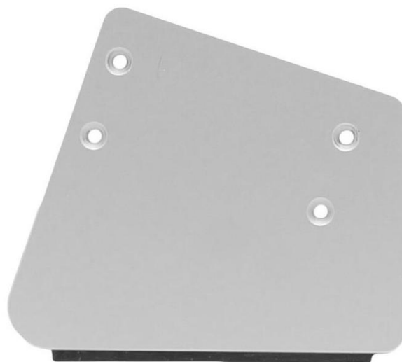
Подставка настольная (правая) X 1