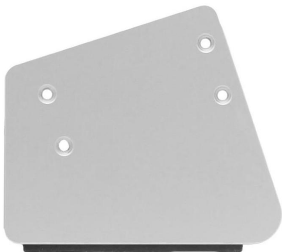
Подставка настольная (левая) X 1