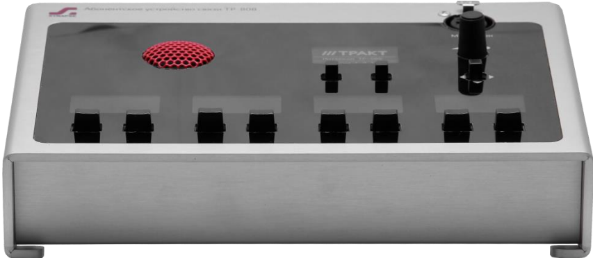
Рисунок 2.2 - Блок TP-808. передняя панель

Внешний вид передней панели блока TP-808 показан на рисунке 2.2.