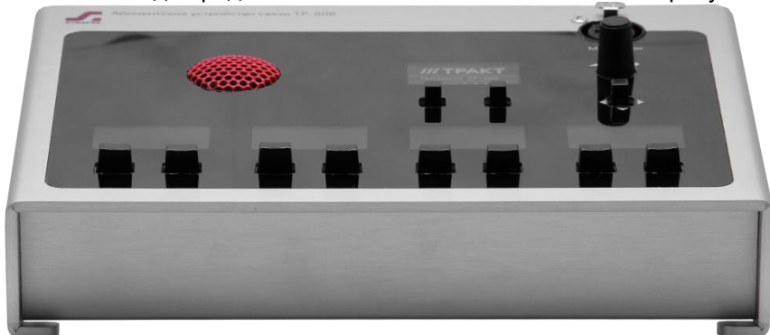
Рисунок 2.2 - Блок TP-808. передняя панель

Внешний вид передней панели блока TP-808 показан на рисунке 2.2.