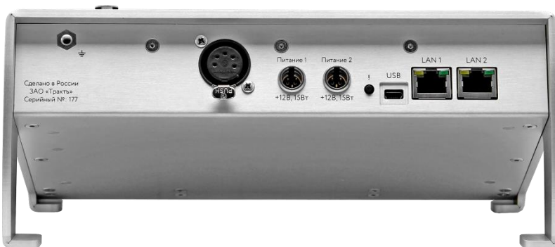
Рисунок 2.3 - Блок TP-808. задняя панель

Внешний вид задней панели блока TP-808 показан на рисунке 2.3.