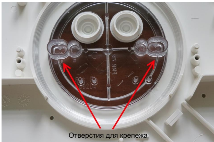
Рисунок 4 - Монтажные отверстия

Вставьте сигнальные провода в клеммник и закрепите их винтами (рисунок 5). На светодиодной плате установлен диодный мост и полярность подключения не имеет значения.