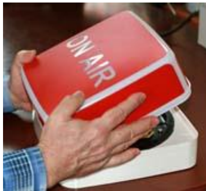
Рисунок 2 - Снятие плафона