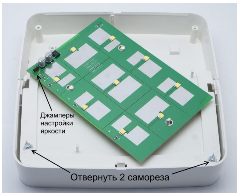
Рисунок 3 - Крышка и светодиодная плата